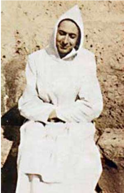
Rafael Arnáiz Barón