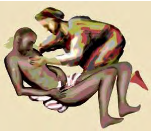
Mensaje de los obispos, Campaña 2005

“Socialmente, este mundo de la salud y la enfermedad está hoy organizado dentro de un sistema sanitario en constante transformación y desarrollo. Un mundo decisivo para toda sociedad donde es fácil constatar luces y sombras, logros admirables y fracasos dolorosos, gestos ejemplares y flagrantes injusticias, tanto en las estructuras como en las personas. Además, en su entorno, se viven las experiencias fundamentales de la existencia: el nacer, el enfermar, la curación, el envejecer, el morir. Son experiencias límite donde se revela la condición frágil y vulnerable del ser humano, donde se vive el dolor y la impotencia, donde se plantean las cuestiones últimas de la existencia sobre su propia identidad y destino.”