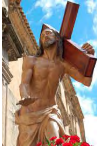
Cristo caído camino del Calvario, de Mariano Benlliure, 1942 (Cofradía de Jesús de la Caída y María Santísima de la Amargura, Úbeda, Jaén)

Triturado por nuestros crímenes (Is 53, 5).