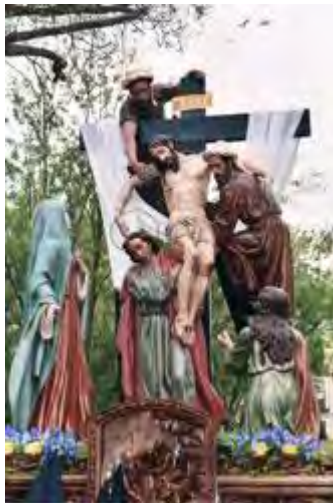
Santísimo Cristo de la Salud,