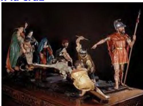
La Crucifixión, de Ramón Álvarez, 1884 (Cofradía de Jesús Nazareno Vulgo Congregación, Zamora)