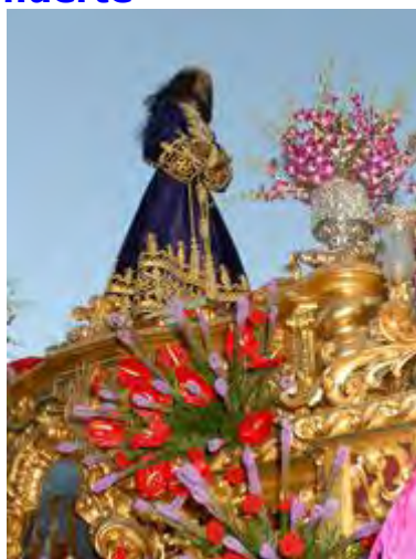
Cristo de Medinaceli , anónimo del siglo XVII (Archicofradía Primaria de la Real e Ilustre Esclavitud de Nuestro Padre Jesús Nazareno de Medinaceli, Madrid)