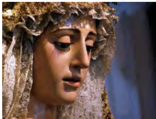
Virgen de Regla , atribuido a Luisa Roldán, siglo XVIII (Hermandad de Jesús del Soberano Poder en su Prendimiento, María Santísima de Regla y san Andrés Apóstol, Sevilla)

«Madre y Señora nuestra, que permaneciste firme en la fe, unida a la Pasión de tu Hijo: al concluir este Vía Crucis , ponemos en ti nuestra mirada y nuestro corazón. Aunque no somos dignos, te acogemos en nuestra casa, como hizo el apóstol Juan, y te recibimos como Madre nuestra. Te acompañamos en tu soledad y te ofrecemos nuestra compañía para seguir sosteniendo el dolor de tantos hermanos nuestros que completan en su carne lo que falta a la Pasión de Cristo, por su cuerpo, que es la Iglesia . Míralos con amor de madre, enjuga sus lágrimas, sana sus heridas y acrecienta su esperanza, para que experimenten siempre que la Cruz es el camino hacia la gloria, y la Pasión, el preludio de la Resurrección».