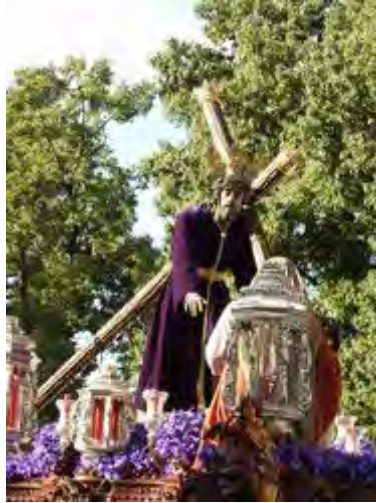
La Verónica , de Francisco Pinto, 1976 (Hermandad del Santísimo y Cofradía de Jesús, María Candelaria y Verónica, Jerez, Cádiz)

Jesús se volvió hacia ellas y les dijo: «Hijas de Jerusalén, no lloréis por mí, llorad por vosotras y por vuestros hijos» (Lc 23, 27-28). El Señor lo guarda y lo conserva en vida, para que sea dichoso en la tierra, y no lo entrega a la saña de sus enemigos (Sal 41, 3).