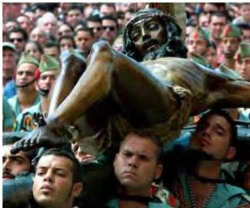
Cristo de la Buena Muerte y Ánimas («El Cristo de Mena»), de Francisco Palma Burgos, 1942 (Cofradía de Mena, Málaga)

Jesús, clamando con voz potente, dijo: «Padre, a tus manos encomiendo mi espíritu». Y, dicho esto, expiró (Lc 23, 46).