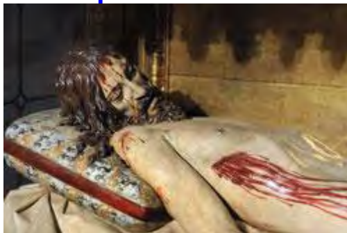
Cadáver de Jesús , de Gregorio Fernández, siglo XVII (Catedral de Segovia)

Y como para los judíos era el día de la Preparación, y el sepulcro estaba cerca, pusieron allí a Jesús (Jn 19, 42).