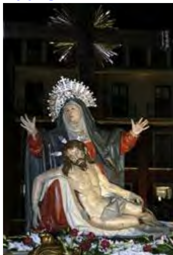
Quinta Angustia , de Gregorio Fernández, 1625 (Cofradía de La Piedad, Valladolid)

« Una espada te traspasará el alma » (Lc 2, 34).