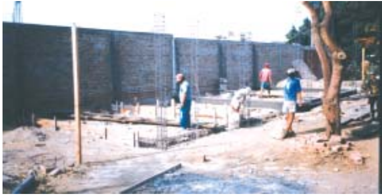
Los «cimientos» de la «Universidad» de Casma. 1998.

En las comunidades de la sierra, apenas hablan el español, el idioma es el «quechua». Su cultura inca aún la conservan, sobre todo en cuestiones de «hechicerías» o «brujeñas». El culto y respeto a los muertos sobresale por encima de todo, en ocasiones el velatorio del difunto dura hasta dos o tres días, invitando a los familiares y vecinos a comer.