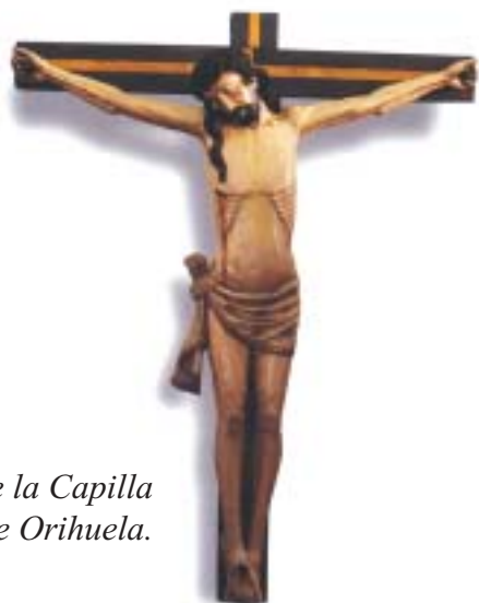
Crucifijo del Retablo de la Capilla del Rosario. Catedral de Orihuela.

En 1735 se encarga a Bartolomé Perales que hiciera el retablo de la capilla del Rosario para la catedral de Orihuela. Dicho retablo fue coronado en su ático por un Crucificado de gran tamaño perteneciente el retablo anterior y situado entre la Virgen y san Juan.