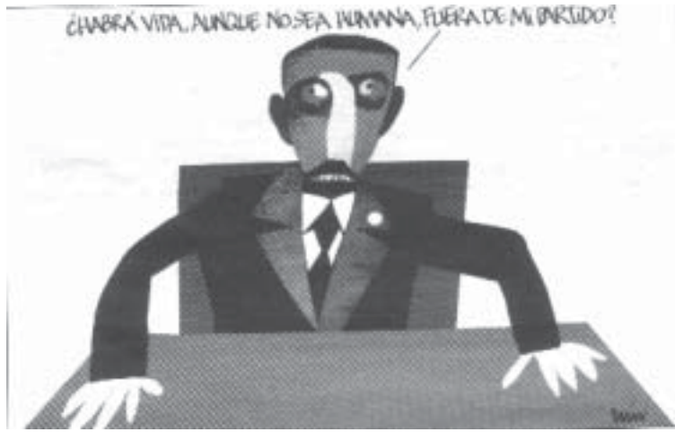
CAÍN (La Razón)