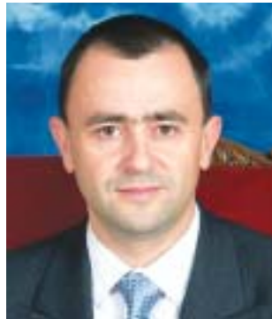
FERNANDO GIMÉNEZ BARRIOCANAL Vicesecretario Económico de la CEE

“ Yo distingo entre un católico y un no católico. Un católico debe marcar la casilla porque tiene la obligación de contribuir al sostenimiento de su Iglesia, en la que ha sido bautizado, ha recibido la Buena Noticia de Jesucristo, y le va acompañar en sus vida. En España se celebran 12 millones de eucaristías al año, 500.000 niños se preparan para la primera comunión, se celebran más de 126.000 bodas y 380.000 funerales. Pero también llamamos a los no católicos, porque es evidente que la Iglesia contribuye de una manera decisiva al desarrollo de la sociedad. Sólo pondré un ejemplo: esos niños que están en primera comunión están recibiendo una serie de valores que conforman un comportamiento social. Además está toda la labor social que desarrolla la Iglesia...”